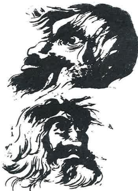
Cabezas de dos demonios. The Magus (1801), de Francis Barrett

La bruixomania va acabar en diferents èpoques segons els països. En general es pot considerar representativa la data de la darrera execució: 1610 a Irlanda, 1684 a Anglaterra, 1692 a Nord-amèrica, 1727 a Escòcia, 1745 a França, 1775 a Alemanya, 1782 a Suïssa, 1793 a Polònia. A Itàlia la Inquisició va condemnar a mort un xerrameca anomenat Cagliostro, el 1791, però conmutà la sentència per la de cadena perpètua. (Ens consta que Espanya va ser el darrer país en abolir la Inquisició a mitjans del segle XIX).