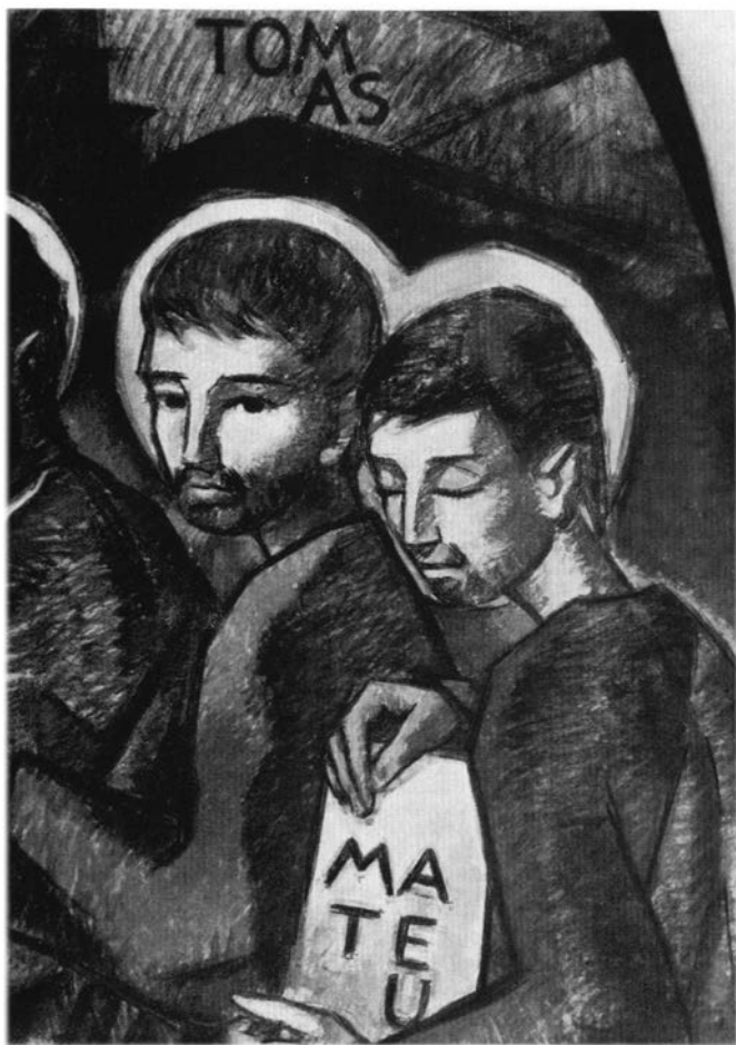
Sant Mateu (Església de Sant Oleguer).