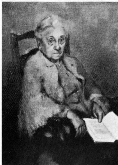
La mare de l'artista, 1957.