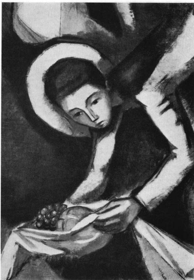
L'ofrena. (Església de Sant Oleguer).