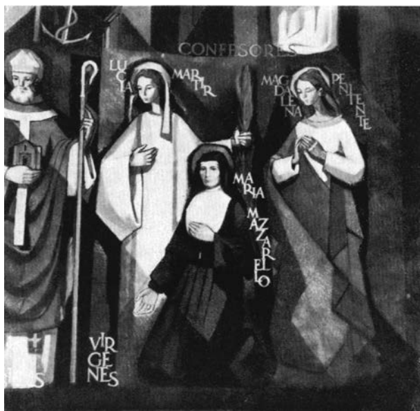
Detall de l'església de Sant Josep i Maria Auxiliadora de Barcelona.