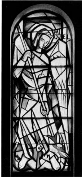
La vidriera de Sant Miquel (Església de Sant Oleguer).