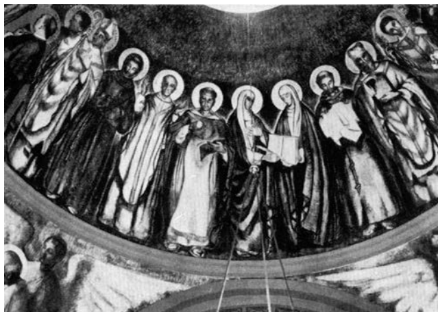
Detall de l'església de Sant Feliu del Racó.